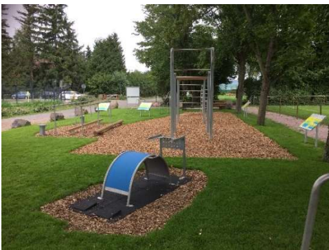
Beispielfoto, Quelle: Gemeinde Einhausen

Auszug aus ISEK (Integriertes Städtebauliches Entwicklungskonzept) bzw. IHK (Integriertes Handlungskonzept) nebst